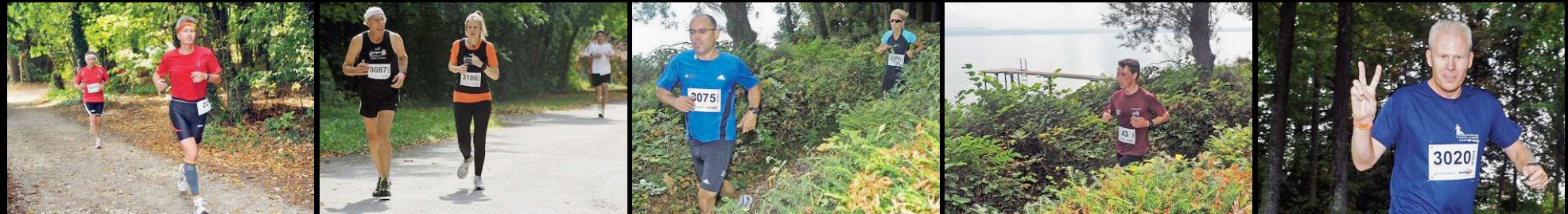
PARCOURS VARIÉ Chemins blancs ombragés ou tronçons asphaltés au soleil, passages en forêt touffue ou au bord du lac, le Fyne Marathon, c'est 100% de nature et de plaisir pour les participants.